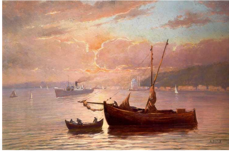
Görsel 3. Ali Rıza Bayazıt, 'İstanbul', 34x50 cm., Tuval Üzerine Yağlıboya, 1943.

Ressam Ali Rıza Bayazıt, 1951 tarihli 'Erdek' (Görsel-4) adlı tablosunu tuval üzerine yağlıboya tekniğinde yapar. Sanatçı askerlik görevi gereği Anadolu'nun bazı kentlerinin yanı sıra Osmanlı Devleti coğrafyasına ait birçok bölgede bulunur. Bayazıt, bu yörelerde bir yandan askerlik görevini yürütür öte yandan da o bölgelerin karakalem, suluboya ve yağlıboya tekniğinde resimlerini yapar. Bu resminde de Balıkesir'in turistik Erdek ilçesinin deniz manzarasını çalışır. Sanatçı, kompozisyon ilkelerine bağlı kalarak, plastik değerleri aradığı bu resminde bir ön ve bir arka plan yapar. Resmin ön planında, sahilde iskeleye bağlı bir balıkçı kayığı; denizde yarısı görünen bir tekne ve iskele; bunların arakasında ise bir balıkçı barınağı vardır. Resmin arka planında ise burun kısmında kayalıklar ve evler bulunan bir sahil; daha gerilerde uzakta ufuk çizgisi üzerinde Erdek'in dağları siluet olarak görülür. Sanatçı, bu resmini yerinde, gözlem yaparak, tonal renk geçişlerine izin vermeden, fırça vuruşları eşliğinde ve dolayısıyla empresyonist anlayışla oluşturur.