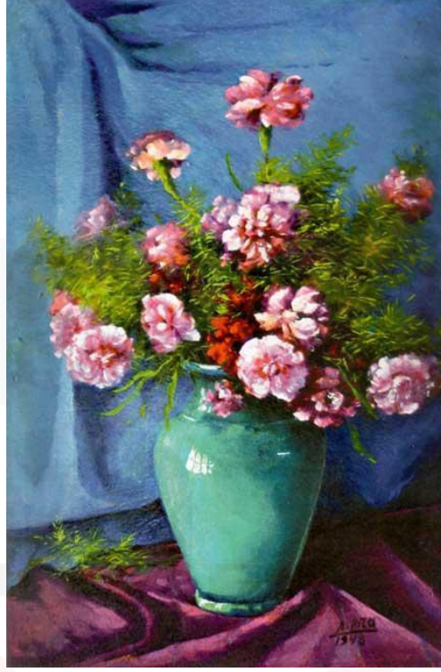
Görsel 5. Ali Rıza Bayazıt, 'Vazoda Karanfiller', 35x60 cm., Tuval Üzerine Yağlıboya, 1948.

geçişlerine yer vermesiyle hocası Halil Paşa'nın realist tavrının izlerini yansıtır. Bayazıt, kompozisyon içinde yer alan kumaşların ve nesnelerin renk seçimleriyle bir yandan kontrastlık yaratır bir yandan da uyum (armoni) arar. Sanatçı, bu çalışmasıyla da hocası Hoca Ali Rıza Bey'in doğa ve objelere (nesnelere) olan gözlemci ve izlenimci yönü ile onları kucaklayan tutkusunun izlerini takip etmek ister gibidir.