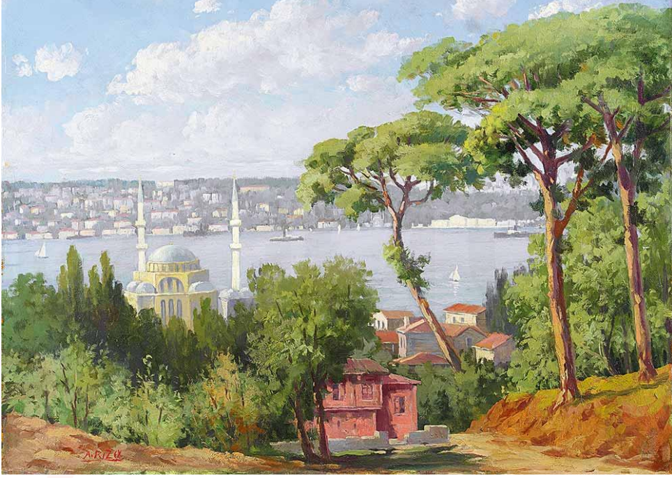
Görsel 2. Ali Rıza Bayazıt, 'Boğaziçi', 35x50 cm., Tuval Üzerine Yağlıboya, Özel Koleksiyon, 1945.

resminde rengi, ışığı, gölgeyi ve perspektifi plastik değerlerin hizmetine sunar. Sanatçı, tonal renk geçişlerini önemsemeden yaptığı serbest fırça vuruşlarıyla da kendi hocası, Hoca Ali Rıza Bey'in empresyonist resimlerini hissettirir. Ali Rıza Bayazıt, hocası gibi İstanbul'un doğal güzelliklerini, tarihi yerlerini, kent silüetlerini vb. gözlemci bir anlayışla resimlerine aktarmak ve onları resim sanatı aracılığıyla sahip çıkarak insanlarla paylaşmak istemektedir.